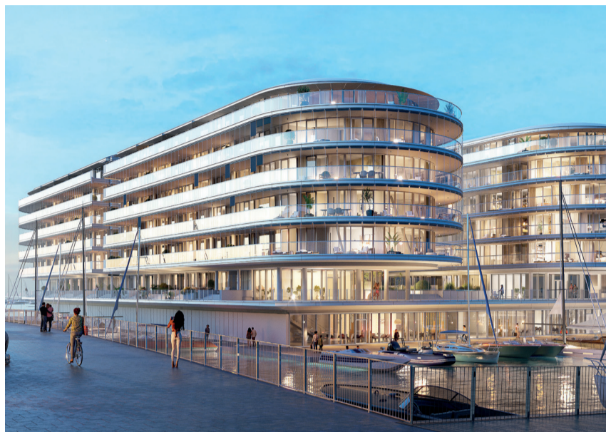
Colpo d'occhio spettacolare Così appariranno gli Scafi, le residenze affacciate sul mare